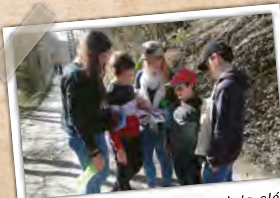
Défis, épreuves et trésor à la clé Uitdagingen, een schat staat op het spel.