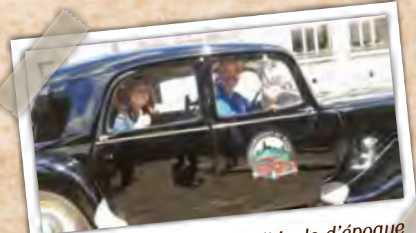
Circuit touristique en véhicule d'époque Sightseeingtour in een oldtimer

Réservation obligatoire - reservatie verplicht (avec chauffeur-guide - vidéo guidage FR/ NL/D/E) (met chauffeur-gids - videogids NL/FR/D/E)