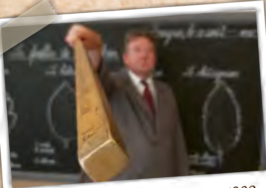
Jeu de rôle dans une classe de 1932 Rollenspel in een klas van 1932