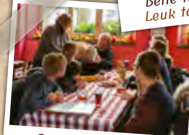
Produits du terroir Streekproducten