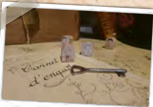
Cluedo grandeur nature en français Levensgrote Cluedo in het Frans

Réservation obligatoire - reservatie verplicht