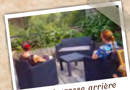
Belle terrasse arrière Leuk terras achteraan