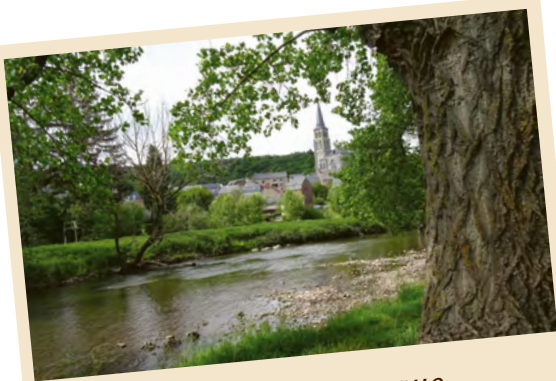
Un coin pittoresque le long du Viroin