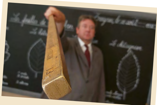
Animation dans une classe de 1932

Dans la peau d'un élève de 1932, vous (re)vivez la discipline d'antan tout en vous amusant !