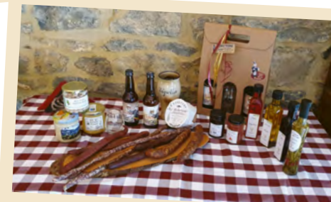
Produits artisanaux de chez nous