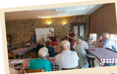
Max. 25 personnes par atelier

Découvrez, dans une ambiance conviviale, les saveurs de notre terroir. Atelier agrémenté de petits jeux.