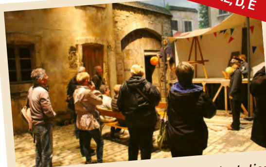
Au fil de 11 scènes, découvrez l'évolution de la vie en Ardenne de 1930 à 1960