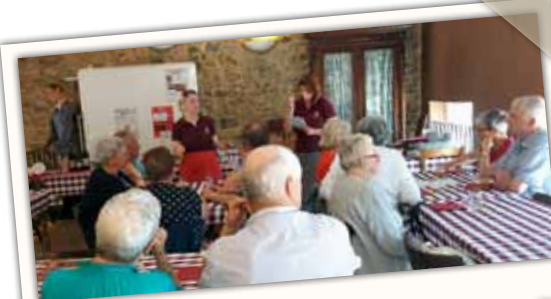
Lekker en leuk!

Workshop aangevuld met spelletjes. Max. 25 personen per workshop.