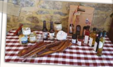
ambachtelijke producten van eigen bodem