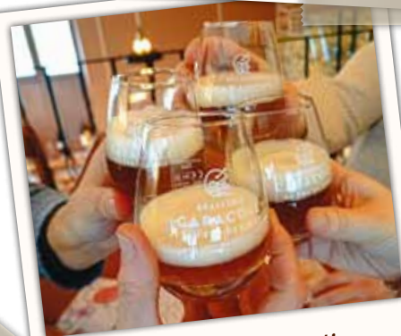
Op je gezondheid!