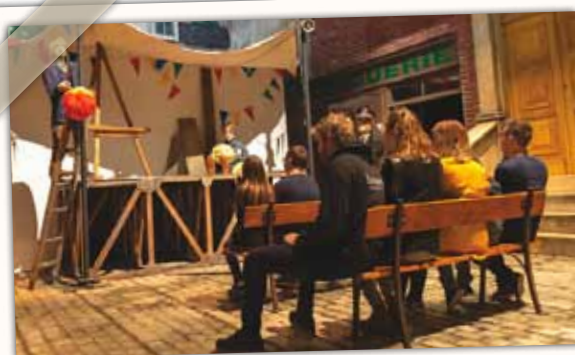
Via 11 scènes ontdek je de evolutie over het leven in de Ardennen van 1930 tot 1960.