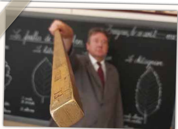
Animatie in een klas van 1932

Als scholier in 1932 kun je de discipline van vroeger (her)beleven, en dat op een leuke manier!