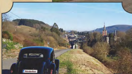
La Traction, en fond le château de Vierves sur-Viroin