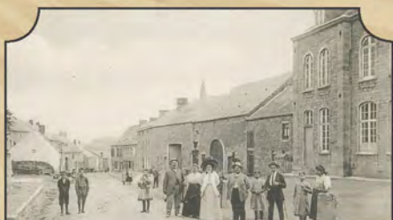
Treignes Maison communale

Deux petits écrans intégrés dans le véhicule diffusent de courtes séquences , déclenchées par GPS : histoire, anecdotes cocasses et images d'époque des villages traversés.