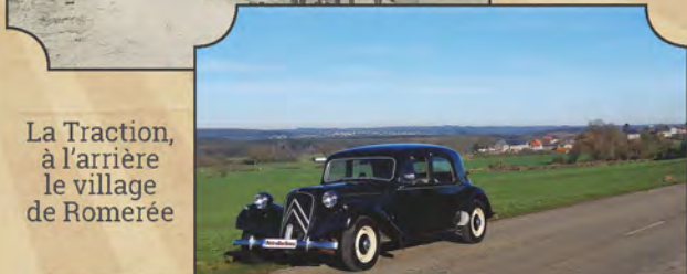
La Traction, à l'arrière le village de Romerée